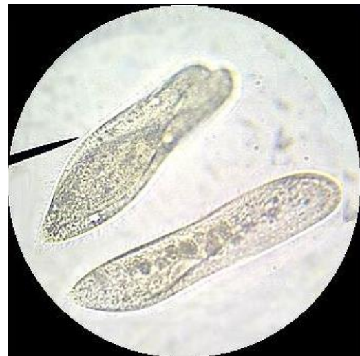
ภาพแสดง : (ตัวอย่าง) โปรโตซัว (protozoa) ชนิดต่างๆ

ในปฏิบัติการนี้ นักเรียนจะได้ศึกษาเกี่ยวกับโปรโตซัว (protozoa) ดังต่อไปนี้