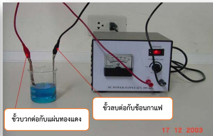
ภาพแสดง : การเรียนปฏิบัติการการชุบโลหะด้วยไฟฟ้า